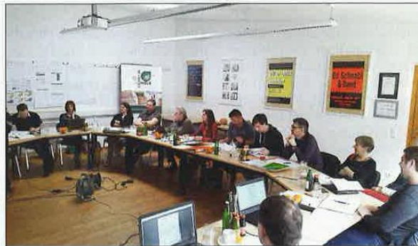
Pioniere in Sachen Gemeinwohlbilanz, Osttiroler Betriebe bekennen sich zum Gemeinwohl.

nen, die Kinder eine gute Ausbildung haben, unsere Bedürfnisse abgedeckt werden können. Ja eh, stimmt. Ich soll ja etwas davon haben, wenn ich mich engagiere, wenn ich etwas riskiere, wenn ich Mut zeige und ein Projekt starte. Wenn ich dabei darauf achte, welche Auswirkungen mein Tun auf die Menschen in meinem Ort hat, wird mir schnell